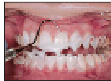
一括で簡単に除去できます。