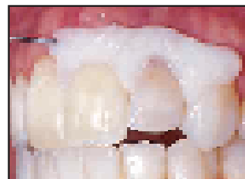
より細かい部位に塗布可能です。