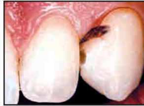
ビスコスタットに浸したウルトラパックを使用すれば、歯肉溝滲出液を制御し、患部を保護します。