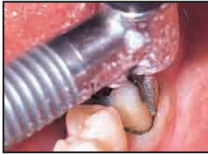
歯牙の形成時、圧排コードがバーにもつれたり抜けたりすることもなく、鮮やかな色調が作業域を明瞭にします。

ウルトラパックは100%コットンを使用して、無数の輪を鎖状に編み込んだ圧排コードです。ウルトラパックはビスコスタットやアストリンジェント、デントインフューザーチップ等の歯肉のコントロール商品と組み合わせて使用頂くとより一層の効果を発揮します。又、通法の塩化アルミナ溶液やエピネフリンを使用される場合においても、通常の圧排コードと比較して保水力が高いため十分な効果を発揮します。